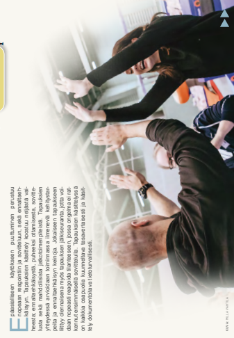
MAA & TILALUOTO

E päasiallisen käytön puuttaminen onnistuu eri tavoin. Tärkeää on ottaa huomioon, että epäasiallisen käytön puuttaminen onnistuu eri tavoin. Tärkeää on ottaa huomioon, että epäasiallisen käytön puuttaminen onnistuu eri tavoin. Tärkeää on ottaa huomioon, että epäasiallisen käytön puuttaminen onnistuu eri tavoin.