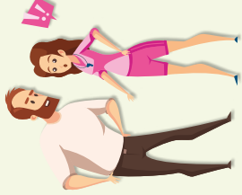
MAA & TILALUOTO